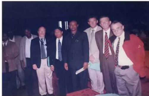
Des diplomates au palais du peuple lors d'une remise d'un rapport du GOHA sur les pillages des commerces en marge de la grève générale de 2007

-De 2007 à nos jours, le président du GOHA International défend les opérateurs économiques victimes de pillages, destructions de leurs biens et autres tracasseries.