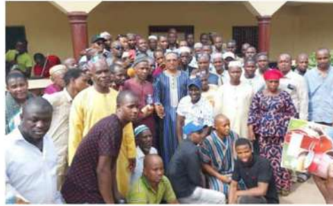
Cérémonie de validation de la section du GOHA international de Tanènè