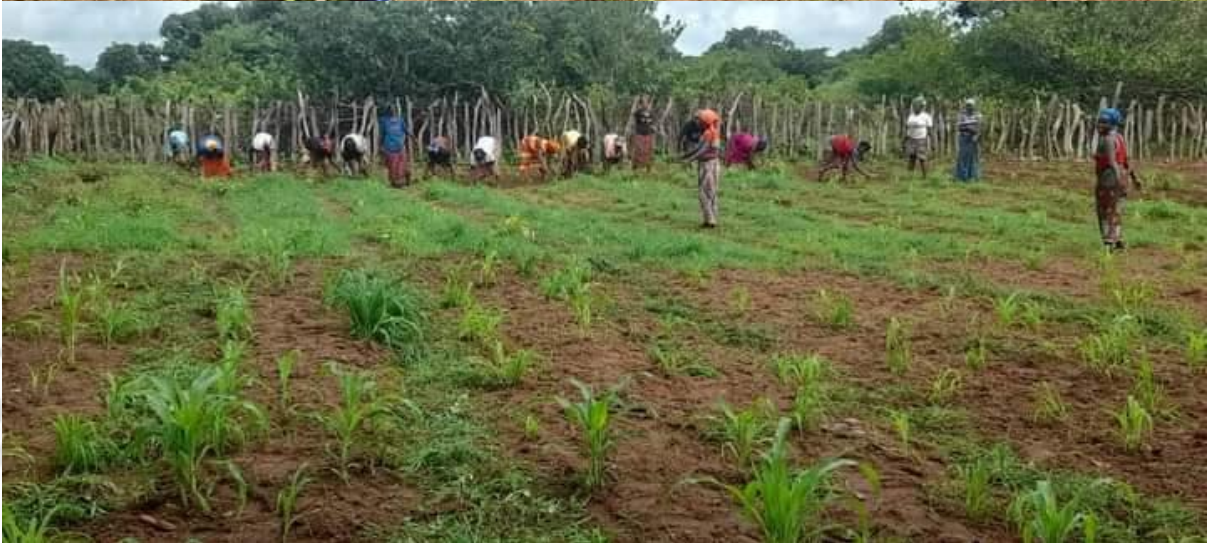
Un groupe de femmes de Sarebhoidho, sous l'impulsion du Président du GOHA INTERNATIONAL, s'est engagé dans le maraîchage