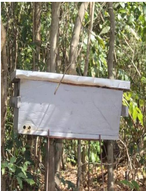
Le GOHA INTERNATIONAL s'investit dans l'apiculture