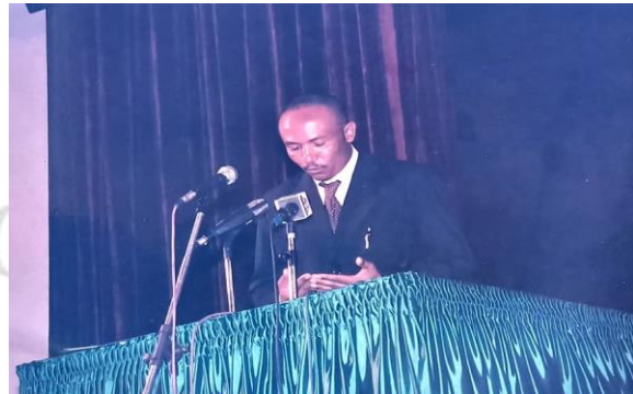
Bénédictions du Président du GOHA INTERNATIONAL

En 2009 : Des bénédictions par le Président du GOHA INTERNATIONAL, après la conférence organisée par le GOHA INTERNATIONAL sur la promotion et la sécurisation des investissements en Guinée au palais du peuple sous la présidence du Capitaine Moussa Dadis Camara