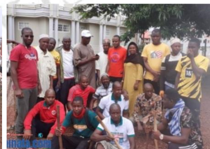
Signature d'un partenariat avec la direction nationale de l'assainissement et du cadre de vie ; le GOHA en plein assainissement des marchés et lieux de culte