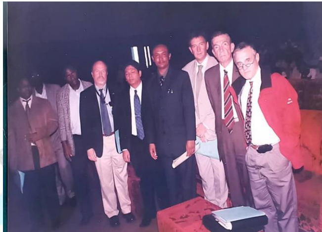
Remise du rapport relatif aux victimes de pillages au palais du peuple