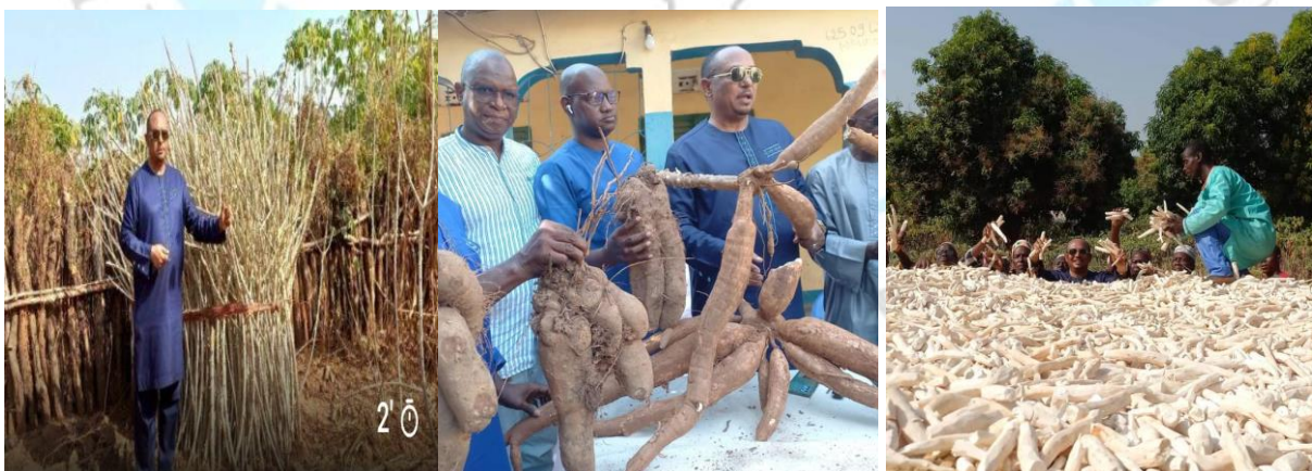
Le Président du GOHA et certains opérateurs économiques essaient l'agriculture pour satisfaire aux besoins des populations en nourriture

Certains commerçants et opérateurs économiques ont déjà commencé à s'intéresser au secteur agricole, des coopératives sont en gestation pour de grands investissements dans le domaine agricole. Ce sont les incendies criminels volontaires récurrents des dernières années dans les champs et plantations des particuliers qui ont poussé les opérateurs à la retenue, jusqu'à ce que l'Etat prenne des dispositions pour freiner ce phénomène décourageant.