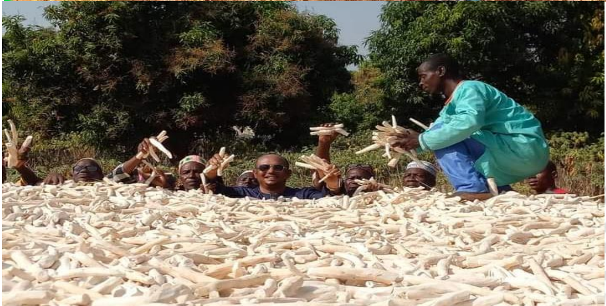
1Le GOHA INTERNATIONAL répond à l'appel du gouvernement pour une agriculture au bénéfice des populations guinéennes