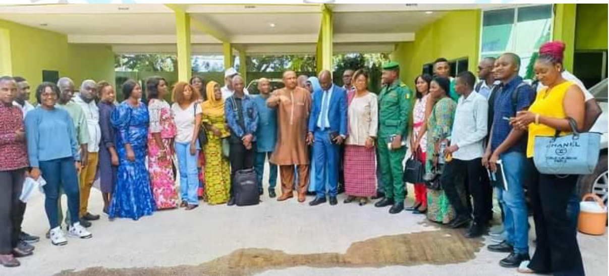
Le Président du GOHA INTERNATIONAL avec les cadres de la direction nationale de l'assainissement et du cadre de vie pour une dynamique assainissement des marchés